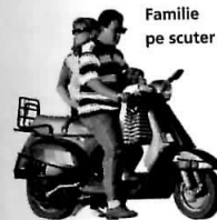
Familie pe scuter