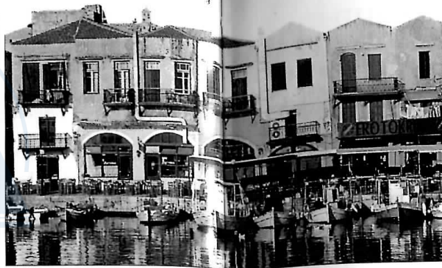
Portul Réthymno, Creta

S-au făcut toate eforturile pentru a oferi informații aduse la zi. Totuși, anumite detalii (numere de telefon, program, prețuri, mijloace de transport etc.) ar putea suferi modificări, pentru care editorul nu își asumă responsabilitatea. S-au păstrat, de regulă, denumirile obiectivelor turistice și toponimele în limba greacă. La sfârșitul lucrării, veți găsi un scurt ghid frazeologic român-grec.