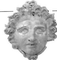
Cap de gorgonă din Evvoia