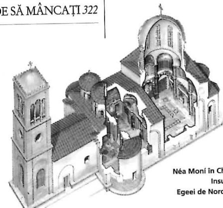
Néa Moní în Chios, Insulele Egeei de Nord-Est

HARTA RUTELOR DE FERIBOT pe coperta a treia