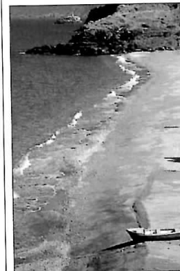
Plaja Kámos de pe Ikaría, Insulele Egeei de Nord-Est