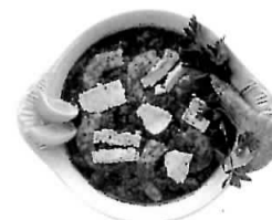
Garides saganáki, crevetle cu brânză feta în sos tomat