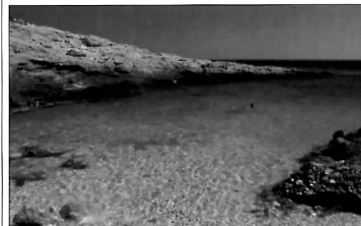
Ape cristaline din Sikinos, caracteristice Cicladelor

Creta, cea mai mare insulă a Greciei, îi face pe turiști să revină pentru multitudinea plajelor, frumusețea naturală – primăvara, coastele se împodobesc cu flori sălbatice – și condițiile excelente. Vestigiul, precum palatele minoice din Knosós (pp. 272–275) și Phaestos (pp. 266–267), așteaptă să fie explorate întocmai ca și aglomeratele orașe port și muzee. Cheile Samariá (pp. 250–251) reprezintă unul dintre principalele obiective din Grecia. Excursionistii vor savura drumul șerpuitor de 18 km, fiind răsplătiți cu un peisaj muntos sublim.