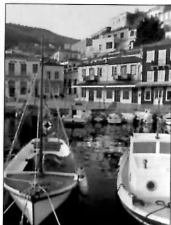
Portul Ydra, împreună cu conace din secolul XVIII, deținute de proprietarii de ambarcațiuni

Singuratica Skýros (pp. 116–117) este un refugiu pentru artiști, atrăgând prin costumele populare, tradițiile insulei, satele de modă veche și turmele de ponei sălbatici, în timp ce Evvoia (pp. 118–119) este faimoasă pentru litoralele pustii și lăcașele muntoase sălbatice.