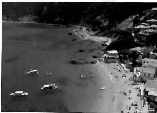
Plaja Agios Nikitas și portul Lefkâda, Insulele Ionice

artiști, temple și coaste împodobite cu flori sălbatice, aceste minunate insule, scăldate de soare, ne oferă, cu orice pretext, vacanțe. Împărțindu-le în șase grupuri, plus Creta, cea mai mare dintre toate, acest capitol ne prezintă principalele grupuri, subliniind cele mai mari tentații pe care le oferă. Vezi și Alegerea insulei , pp. 12–13.