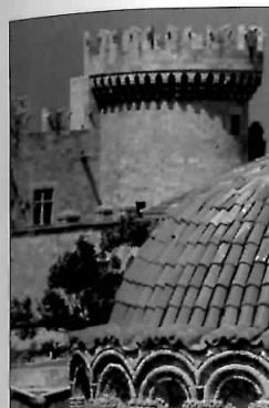
Turnurile fortificate ale Palatului Marelui Maestru, în Ródos