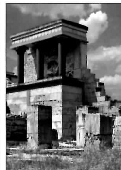
Palatul minoic din Knosós, Creta, construit în jurul anului 1700 î.Hr.

micuța Delos (pp. 218–219) este unul dintre cele mai importante situri arheologice din Grecia, dar și un uriaș muzeu în aer liber.