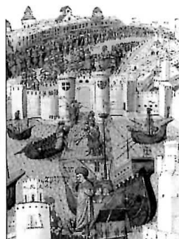
Sosirea prințului turc Cem în Ródos (sec. XV)